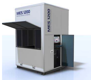
Kontejnerové úložiště s kapacitou 1,2 MWh

■ Technologie HE3DA® nevyužívá běžné elektrody nanesené v tenké vrstvě několika mikrometrů na folie, ale výrazně vyšší elektrody silné i několik milimetrů. Možnost chlazení vnitřního prostoru článku elektrolytem a jeho regenerace zvyšují životnost článku a zmenšují velikost bateriových modulů.