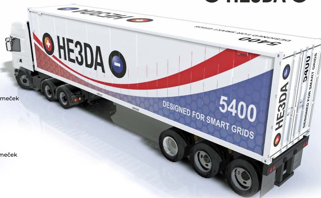
Mobilní kontejnerové úložiště s kapacitou 5,4 – 8,1 MWh