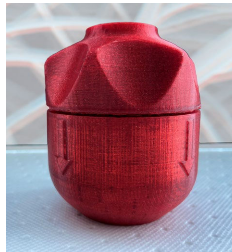
Domácí filtrační zařízení Clutex Filter