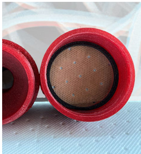
Použitý filtr RIFTELEN® N15